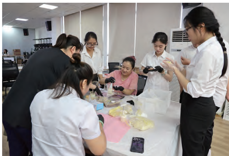
9月14日下午,徐圩公司开展“清风明月 廉润徐圩”主题活动。猜谜语、月兔萝卜、廉“融”月饼DIY环节等趣味活动,弘扬传统习俗,彰显传统文化魅力,增进职工凝聚力和向心力。(孙祥艳)

为贯彻落实公司“三转”战略要求,供电公司纪委持续开展“监督的再监督”,突出“常、直、严”常态化工作基调,围绕中心服务大局,抓早抓小,扎实、切实发挥好纪检监察保障执行和促进完善发展作用。