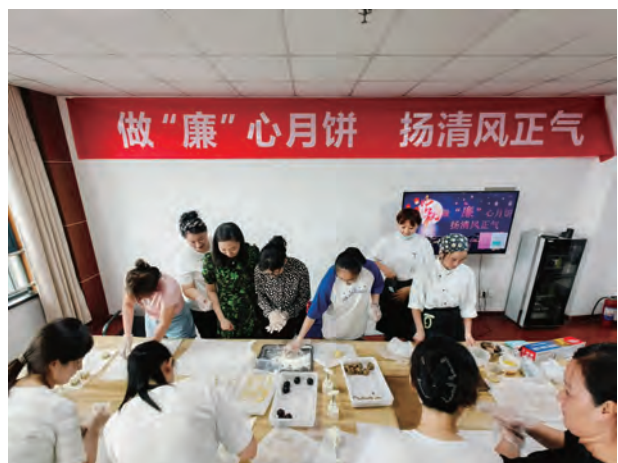
为营造风清气正的节日氛围,中秋节前,金航公司纪检开展“做廉心月饼 扬清风正气”主题活动,通过观看警示教育片,制作莲蓉月饼等,让廉政“清风”真正沁入每一位职工的心田。(许薇)

拉起廉洁自律“警戒线”。公司纪检组织广大党员干部学习违反中央八项规定的典型案例,组织观看警示教育专题片,教育大家警示自身,廉洁自律,自觉净化自己的社交圈、生活圈、朋友圈,做到交往有原则。让党员干部认真对照典型案例汲取教训,引以为戒,时刻恪守党规党纪及企业制度,自觉接受组织和职工的监督,共同营造风清气正的节日氛围。(房 纪)