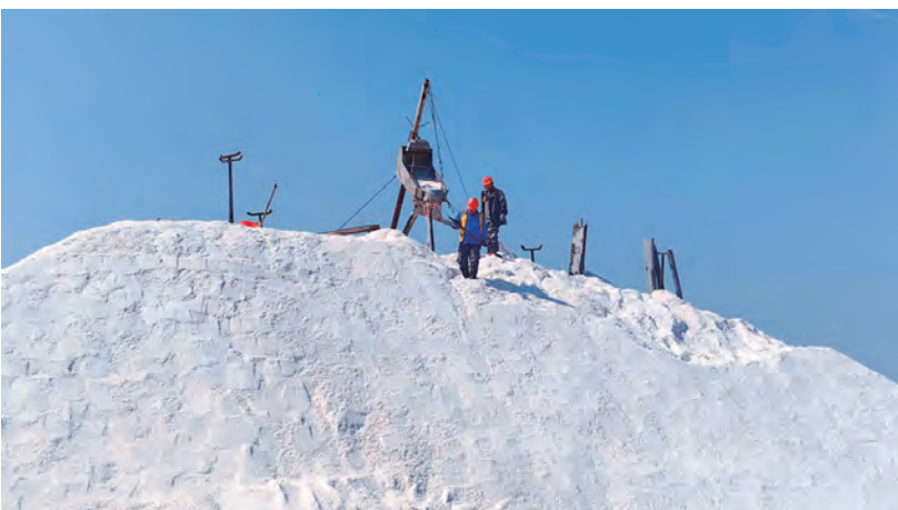
连日来,日晒制盐公司正紧锣密鼓地进行秋季扒盐作业,万亩盐田展现一派丰收景象。截止目前,已扒盐1.8万吨,预计10月底完成秋扒工作任务。(西宣)

工作人员通过全面摸排、调研评估、分类盘活等方式,推动国有资产保值增值,为公司高质量发展注入新动能。按照因地制宜、分类盘活原则,通过招商引资委托运营、跨区域整合闲置资产、腾退土地再开发等方式,结合调剂利用、内部挖潜等手段,全力为资产盘活找出路。今年以来,共盘活闲置资产面积约2000平方米。(陈健)