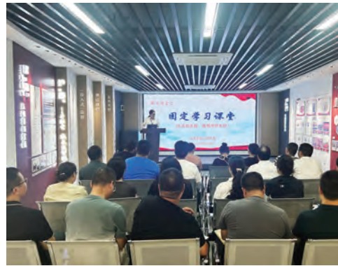
近日,台北投资公司纪委举办第一期“廉洁课堂”,50余名党员干部在廉洁教育室共同学习了党的二十届三中全会精神、观看了警示教育片《镜鉴家风》。(陈炳辰)

多措并举强氛围,融入教育筑牢阵地。多样化提醒笃定“清廉”心,以警示教育为“切口”,将精准开展警示教育作为一体推进“三不腐”的重要抓手,做实做细“关键少数”、关键岗位、青年员工廉洁警示提醒,通过案例警示教育、参观警示教育基地、观看廉洁电影等多种形式,上紧纪律“发条”。以廉政谈话为“抓手”,面对面交流绷紧“守廉”弦,除落实好常规警示、廉政教育外,聚焦不同业务部门不同岗位职责人员,有针对性地组织开展各类提醒、集体廉洁谈话,引导严抓严管、担当尽责。(唐玲)