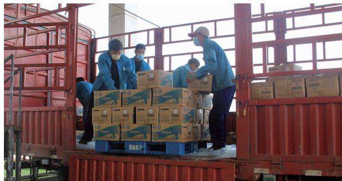
近期,国内部分地区疫情出现反弹,盐产品供应紧张。金桥制盐公司开足马力,克服高温天气、路段管控、运力紧张等困难,全力保障产品发运。7月以来,累计发运各类大小包装盐产品1.2万吨,有力保障了市场供应。(金宣)