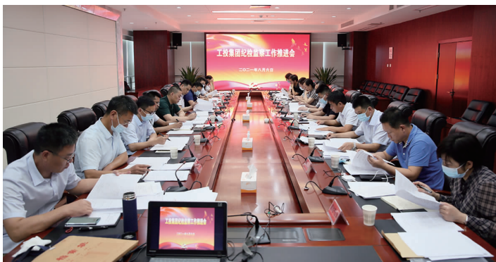
8月6日下午,集团公司纪委召开纪检监察工作推进会,总结今年以来纪检监察工作取得的成效,认真分析存在的不足和问题,并对下一步重点工作进行了部署。相关单位纪检部门在会上作了交流发言。(工宣工纪)