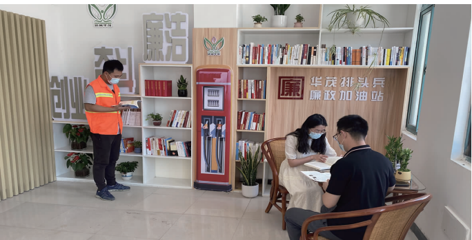
“近日,华茂绿化工程公司在廉政教育室旁设立“廉政读书角”,添置廉政文化类、反腐倡廉类、法律法规类、党纪条规类等书籍,以及疫情防控宣传手册共300余册,激励广大职工通过学习,筑牢拒腐防变的思想道德防线,让“廉政书香”飘满华茂。(陈炳辰)