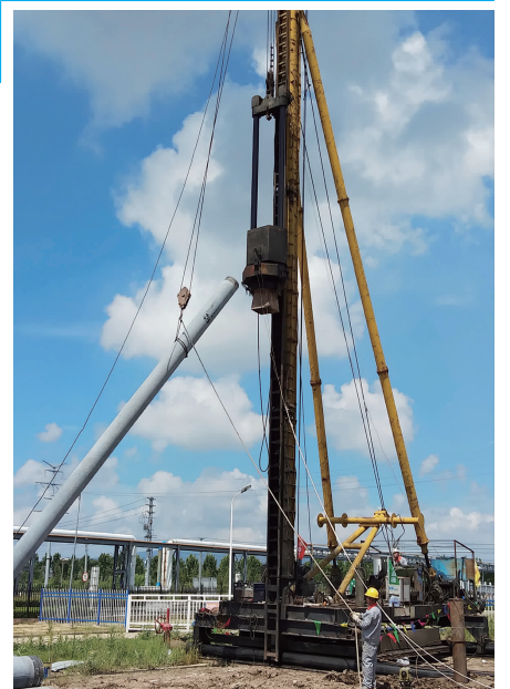
8月2日,利海化工公司循环水改造及清下水综合利用项目开始施工建设。该项目总投资约430万元,计划建设周期约7个月。项目实施后,每年可节约用电约48万度,节约用水约12.5万吨,有效降低生产消耗,改善厂区空气环境。图为项目施工打桩现场。