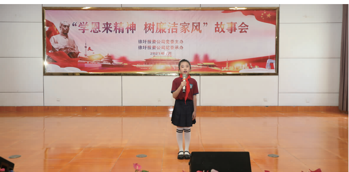
日前,徐圩投资公司举办“学恩来精神·树廉洁家风”故事会,活动邀请老、中、青、少四代人围绕主题,依次为大家讲述《周恩来家风故事》《守廉洁树自律家风》等8个故事。教育引导全公司党员干部争当新时代党员“六个表率”,助推企业高质量转型发展。(陈健 王岩)